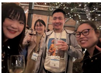
ブラックロックに勤める方と交流を行った。

ブラックロック社主催の国際交流会に参加し、海外の研究者と研究内容やキャリア形成について活発に意見交換を行い、国際的なネットワークを広げる貴重な機会となった。また、日本人研究者交流会にも参加し、国内研究者間での情報共有や研究相談を通じて新たな繋がりを得ることができ、今後の研究推進に資する有意義な場となった。