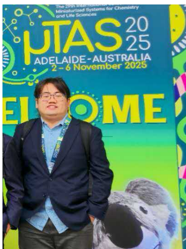
学会会場での記念撮影